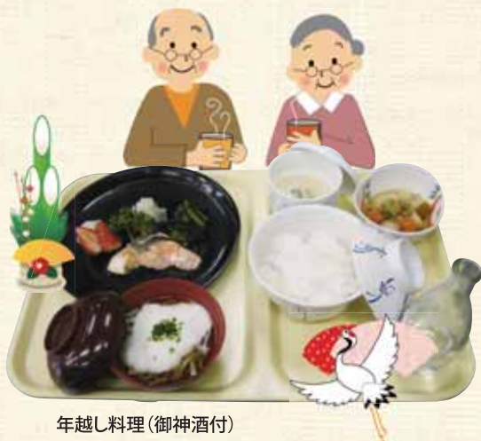
年越し料理(御神酒付)