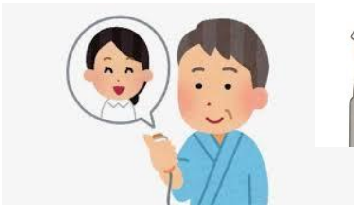
ナースコール対応