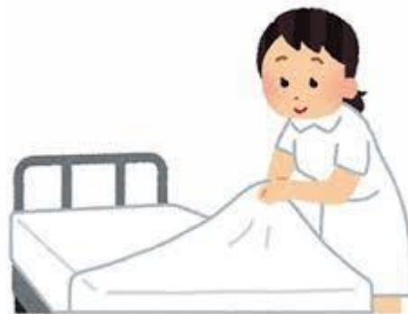
ベッド移動・ベッドメイキング