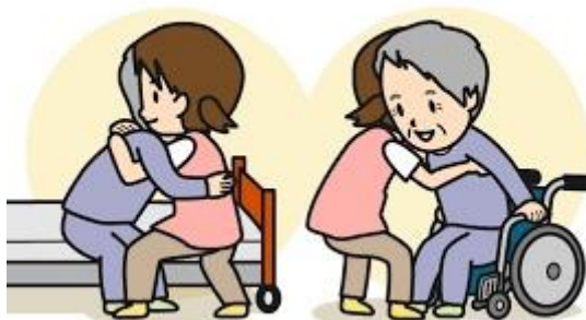
移動・移乗の援助