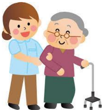
検査・外来受診送迎