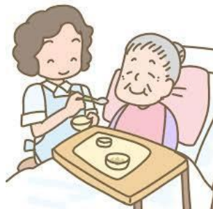
配下膳・食事介助