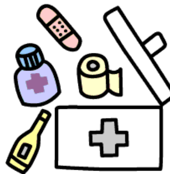
物品の準備・片付け