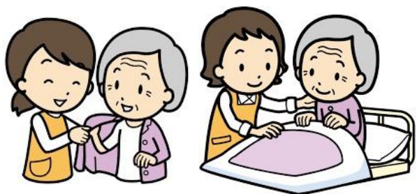
モーニング・イブニングケア